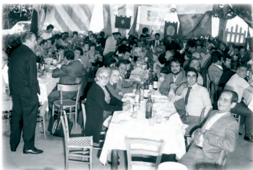
Sopra e di fianco due momenti della festa del 10.10.1971, sotto un gruppo di donatori fuori il ristorante "LE GHIAIE" in occasione della giornata del 14 ottobre 1973