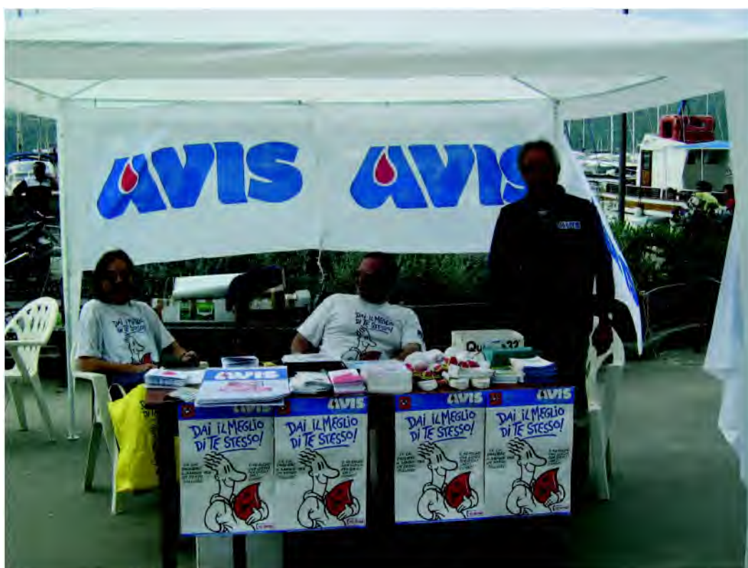
Festa del volontariato a Porto Azzurro