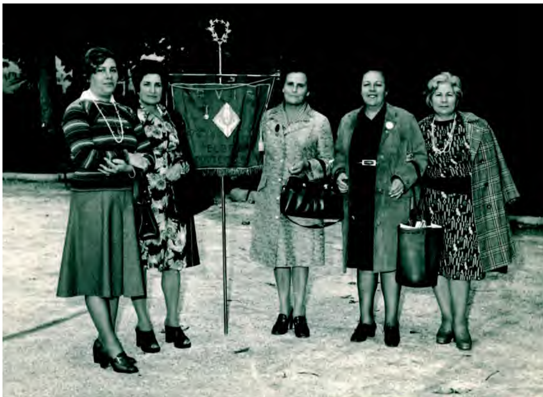
Alcune ragazze nel 1975