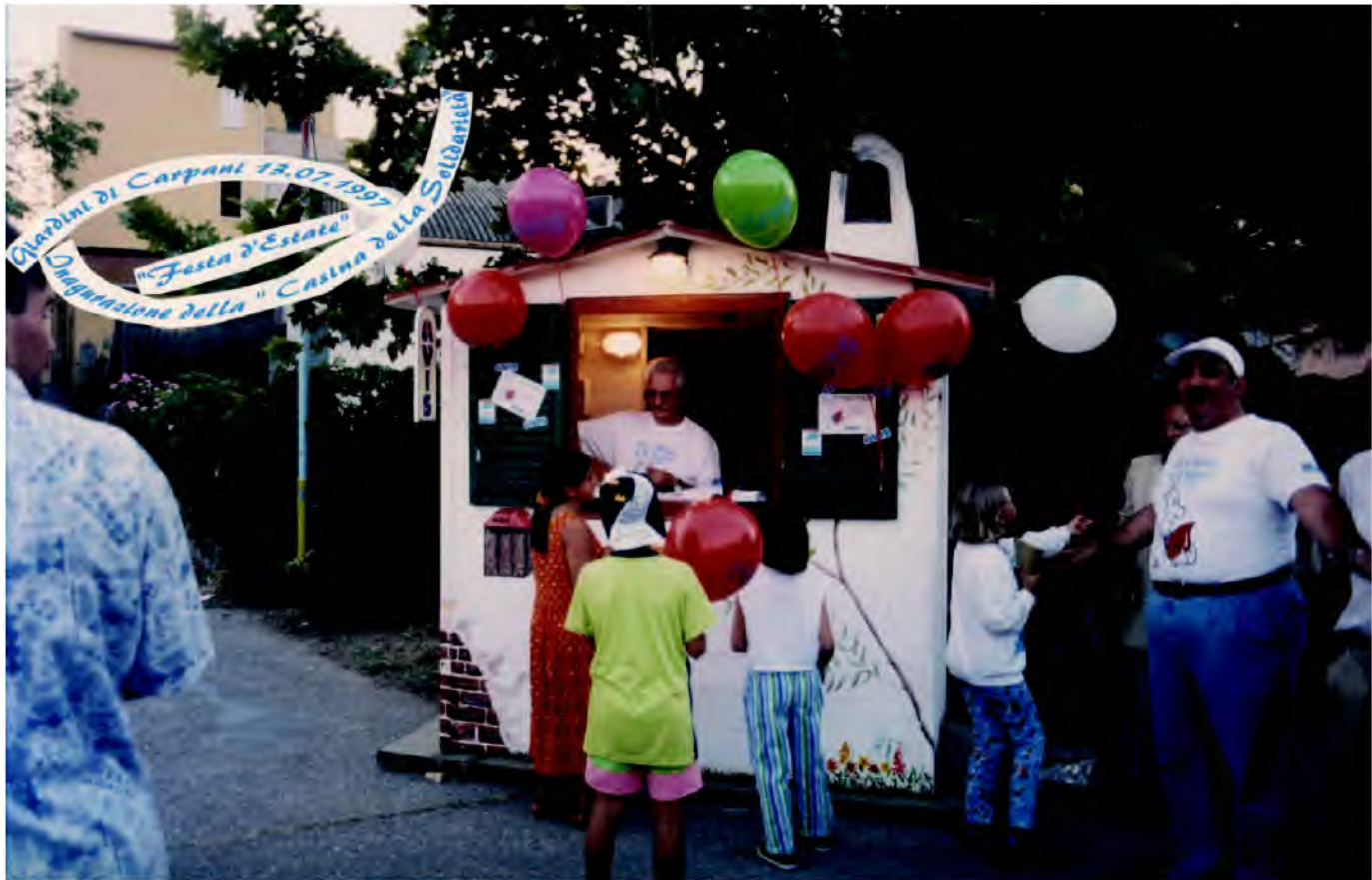
Giardini di Carpani luglio 1997- inaugurazione della casina, da allora è stato il punto riferimento per le iniziative natalizie, come casa di Babbo Natale