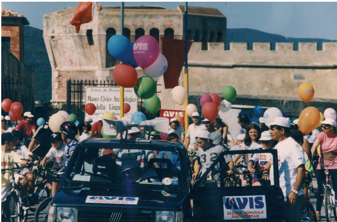
Per alcuni anni portoferraiesi e turisti, ci hanno seguito in bici per la passeggiata fino a San Giovanni con "UN COLPO DI PEDALE E VAI PER LA VITA".