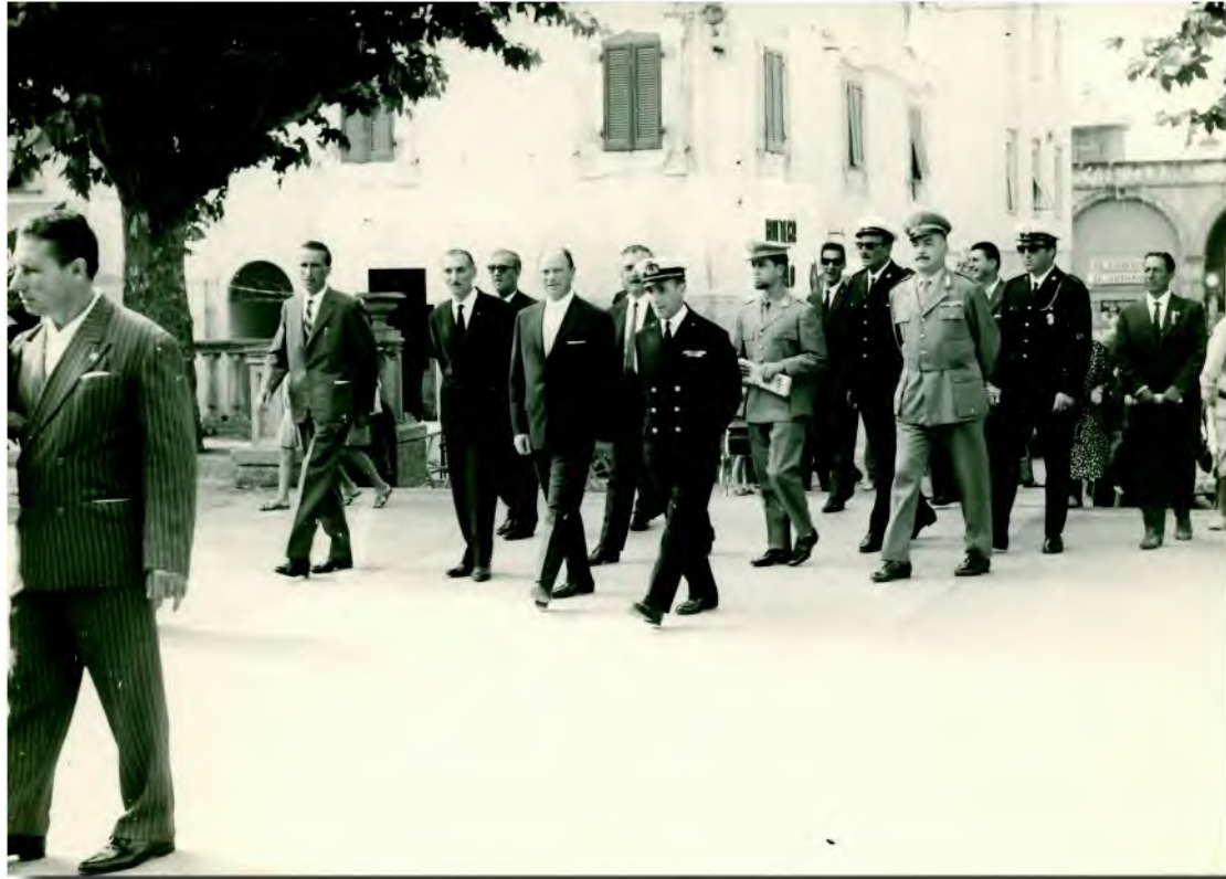
Di seguito due momenti della celebrazione, nella sala consigliare, della festa del 12 settembre 1965