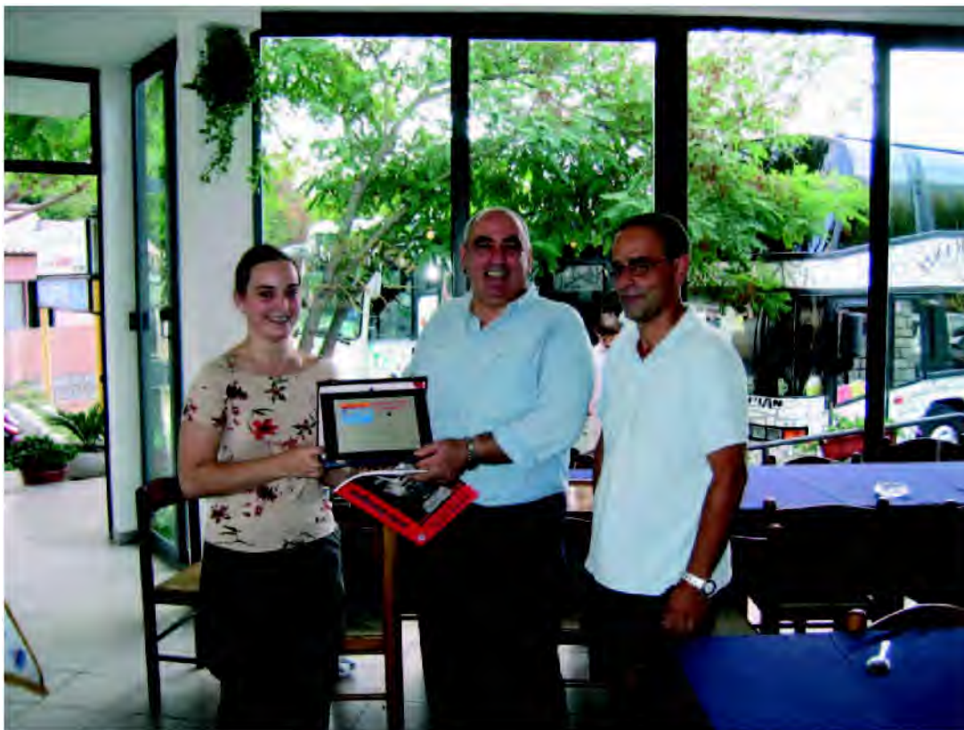
Incontri con le consorelle: sopra La sezione di Seregno sotto quella di Sorano