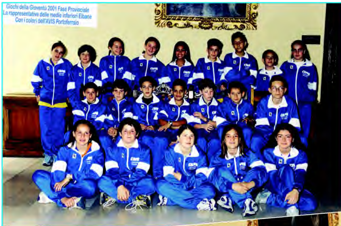
Giochi della Gioventù 2001 Fase Provinciale La rappresentativa delle medie inferiori Elbane Con i colori dell'AVIS Portoferraio

Nell'anno 2001, le rappresentative degli studenti elbani delle scuole medie inferiori e superiori alla fasi provinciali dei campionati sportivi studenteschi, vestono i nostri colori.