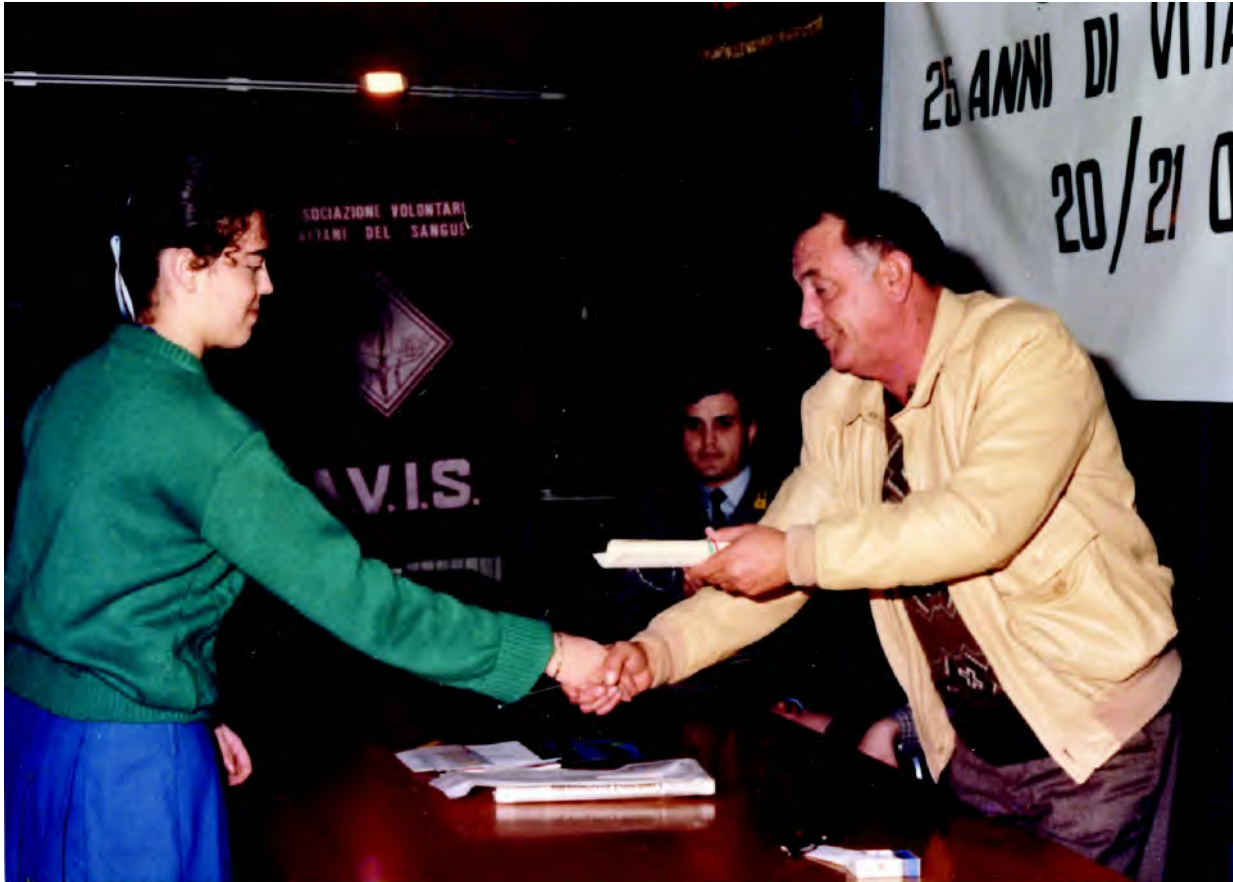
Il Presidente Paglia premia una studentessa, una dei vincitori del concorso di disegno sul tema della donazione di sangue, indetto per l'occasione tra gli istituti superiori. Sotto la platea della sala della provincia piena di giovani