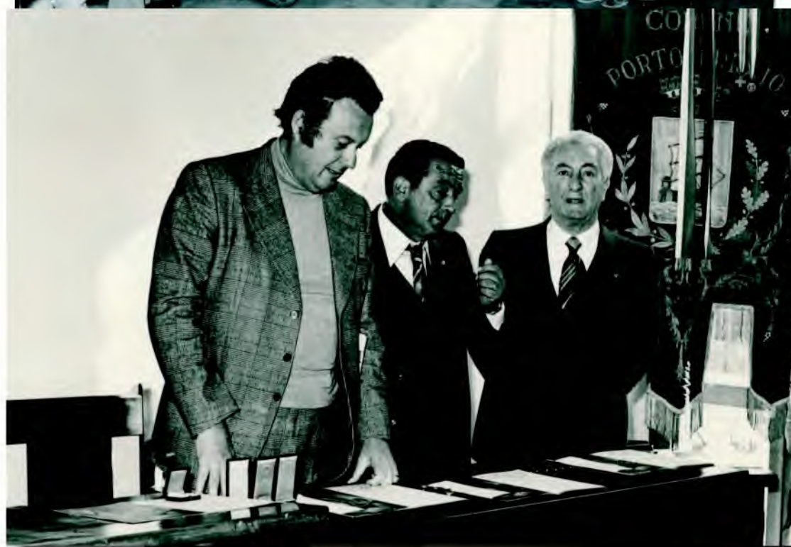
alcuni momenti della giornata del 15 ottobre 1977