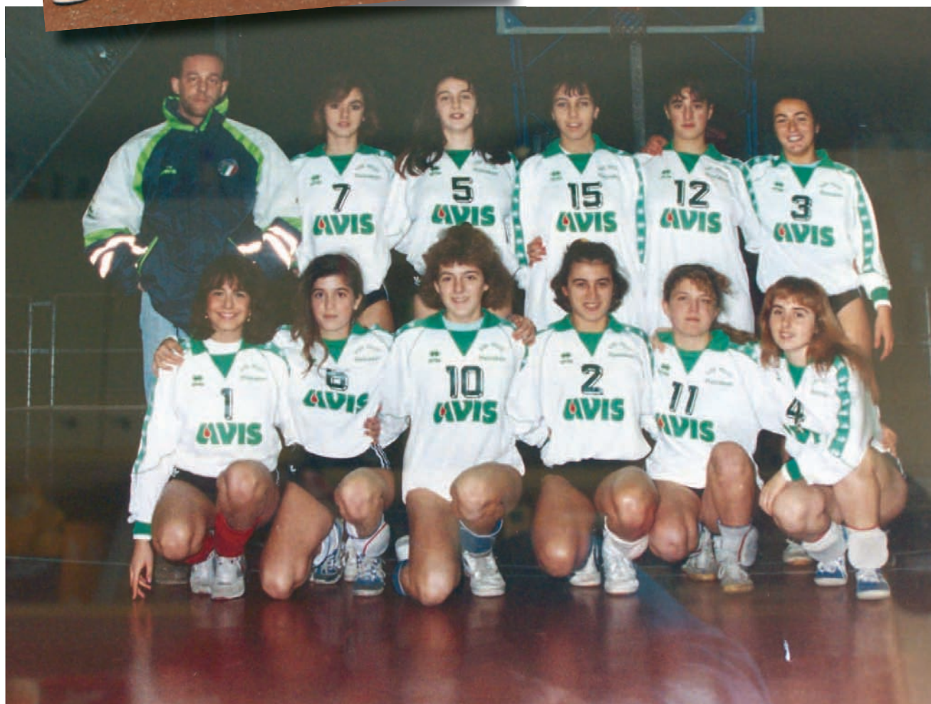
Anche l'Elba Volley ha portato i colori dell'AVIS di Portoferraio