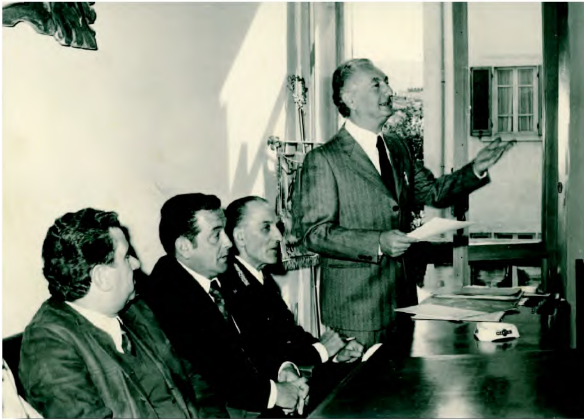
Sala Consigliare 19 ottobre 1975