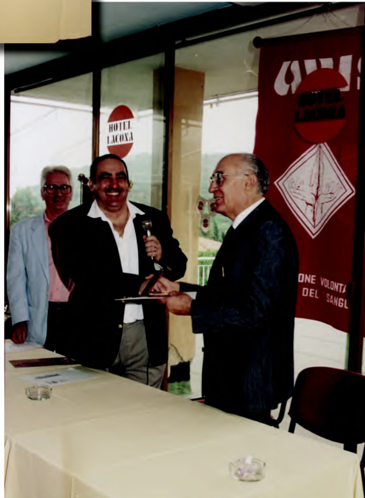
Sotto: mentre consegna la medaglia d'oro al presidente Walter Colombo