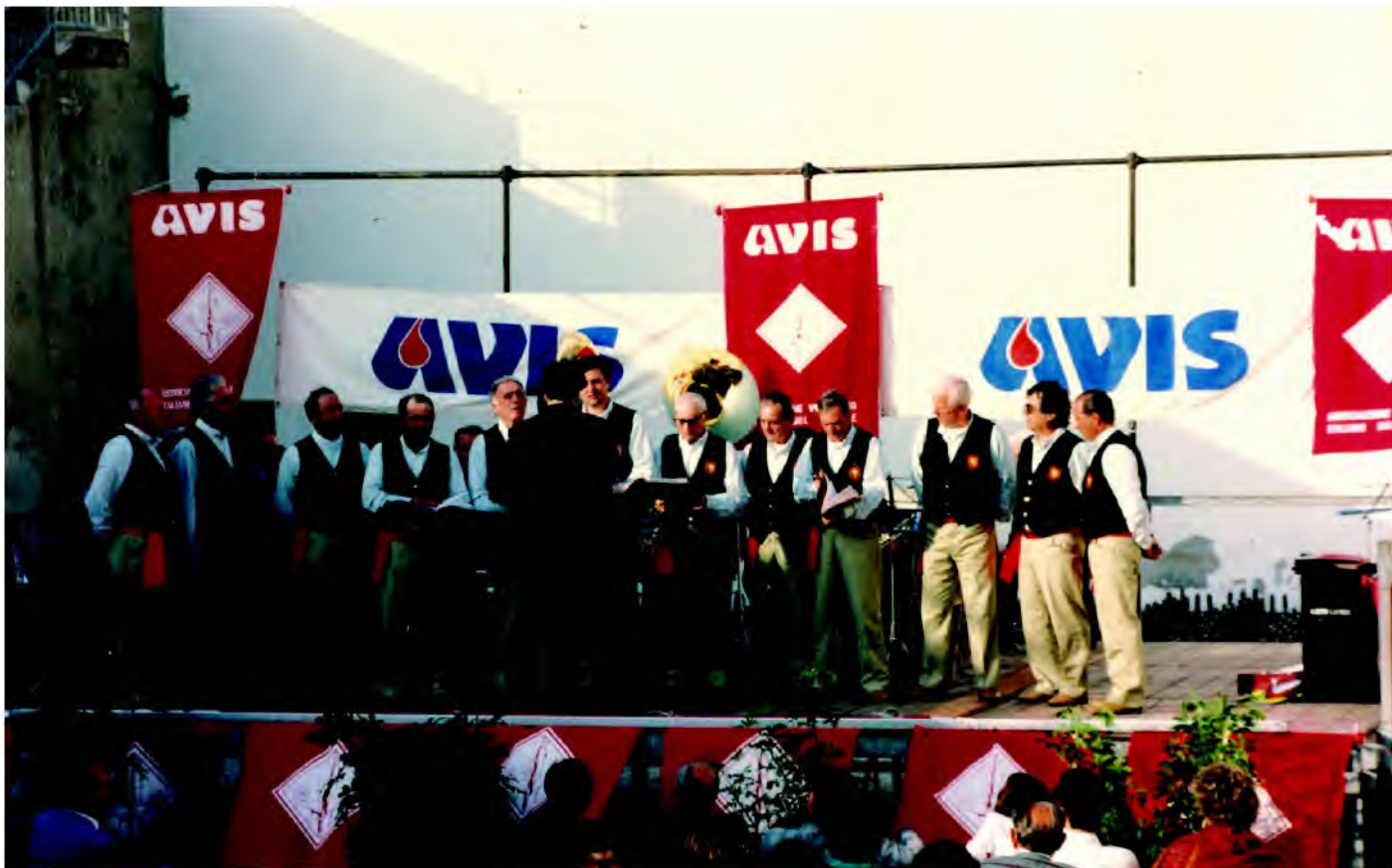
Sopra i "CANTORI DI MAREMMA" durante la loro esibizione, sotto alcuni elementi della Filarmonica "G. PIETRI" durante il concerto