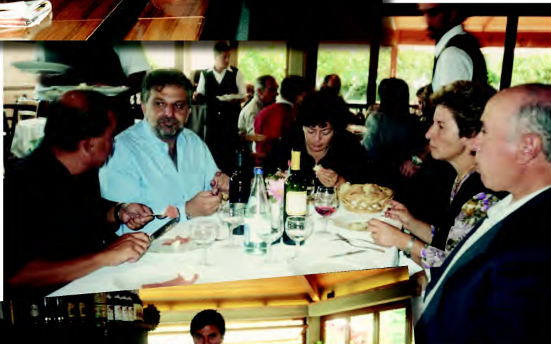
Alcuni momenti del pranzo sociale presso il ristorante "Il Giardino" di Porto Azzurro