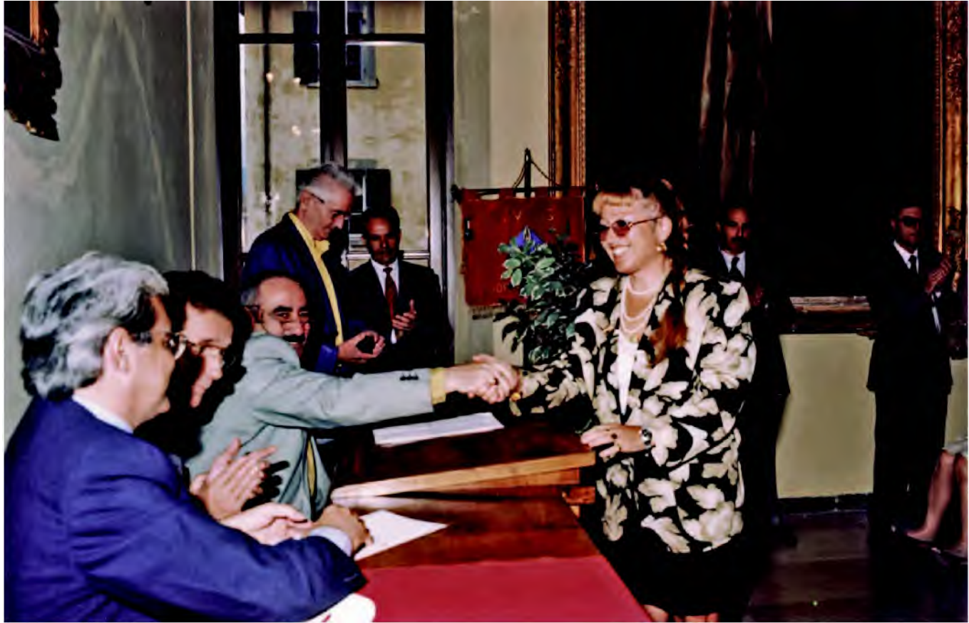
4 ottobre 1998 - Sala Consigliare