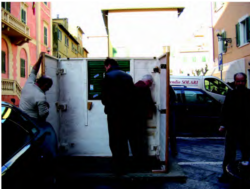
Vari sono stati negli anni i mezzi usati e le strade percorse da Babbo Natale per arrivare alla nostra casina (nella foto in fase di montaggio in uno dei natali)