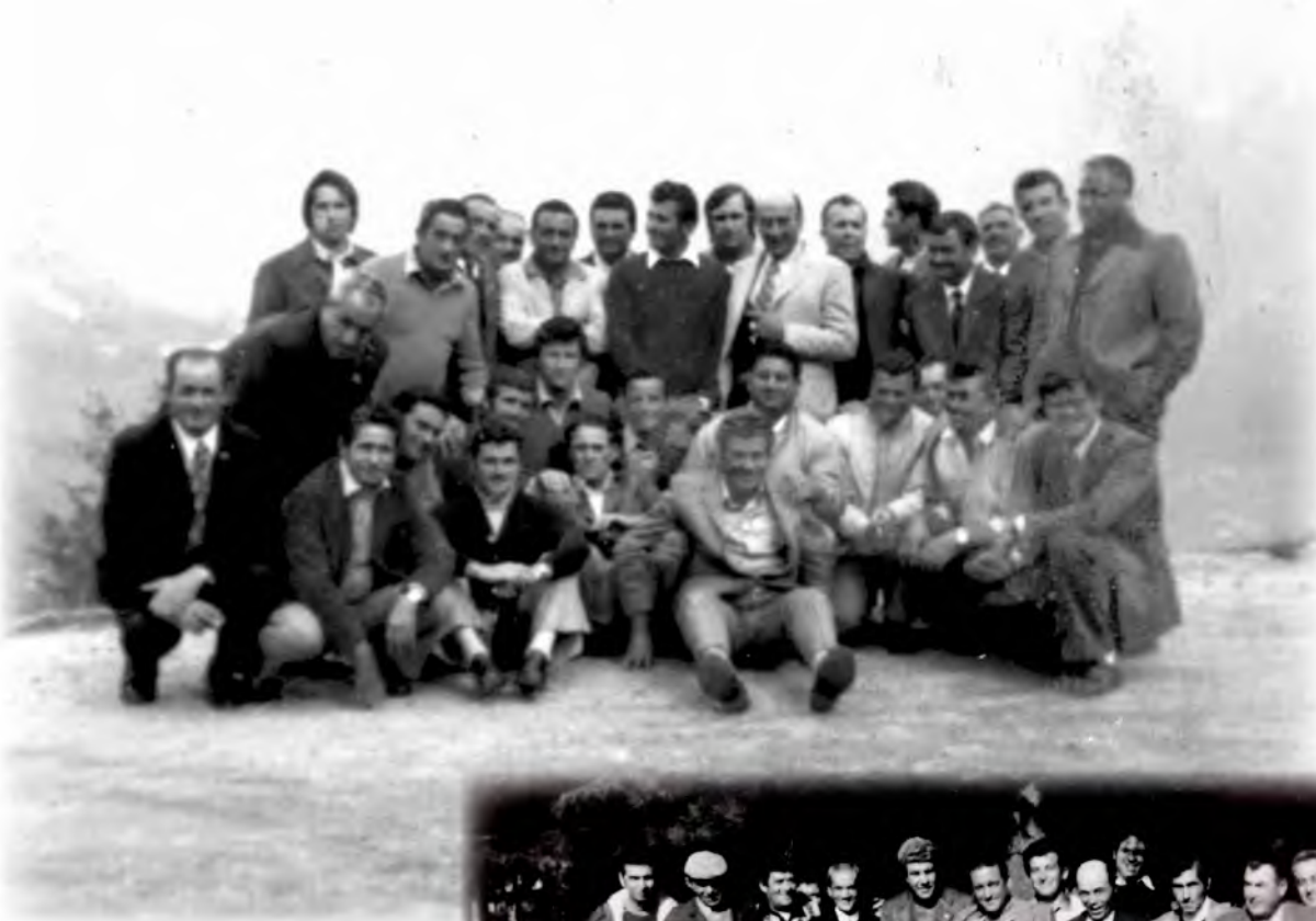
Ma anche fuori dell'Elba come a Milano 1971, Castel del Piano 1975 ed in Umbria nel 1984.