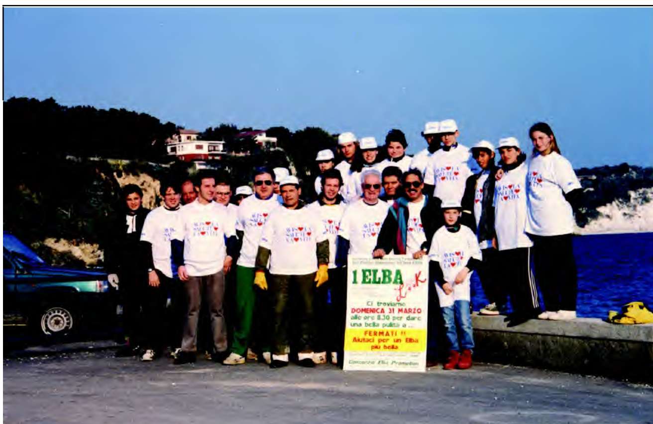
E non abbiamo dimenticato neanche l'ambiente..... Nella primavera 1996 un gruppo di donatori, con i figli e parenti, partecipa alla pulizia delle spiagge di Portoferraio