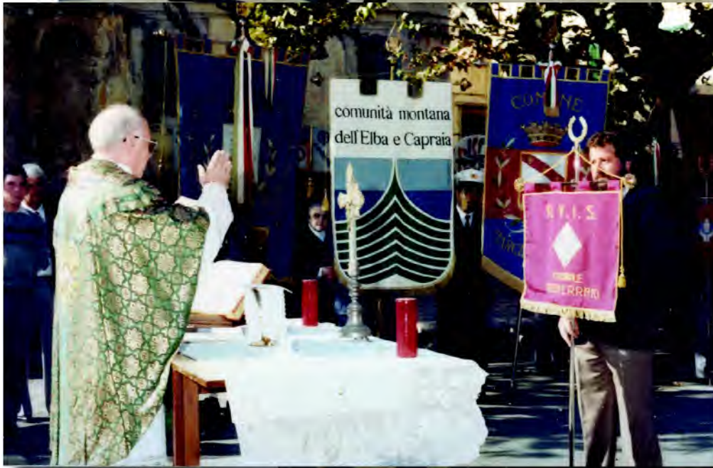
Alcuni momenti della manifestazione per il 25° anniversario della fondazione